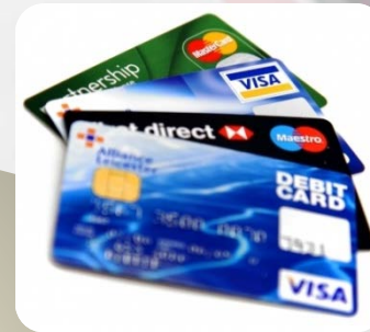
支付系统/ 电子钱包