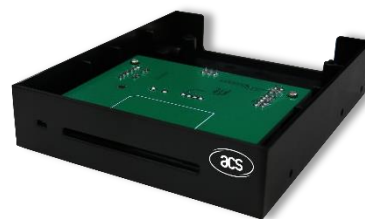
Smart Floppy (全尺寸卡)