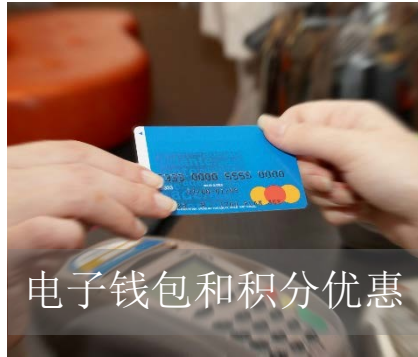
电子钱包和积分优惠